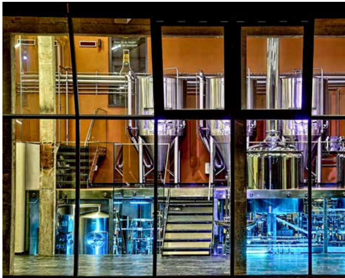
Aus dem ehemaligen Öllager der Brauerei Murau entstand die Schaubrauerei.