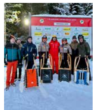
Gemeinsames Rodeln auf der Winterleiten.